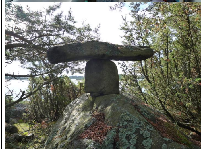
Kuva 3. Erikoisia kiviä ja kiviasetelmia paikannettiin merivaeltajien retkikohteiksi. Kivien tarinat kirjoitettiin kartan selosteeseen.