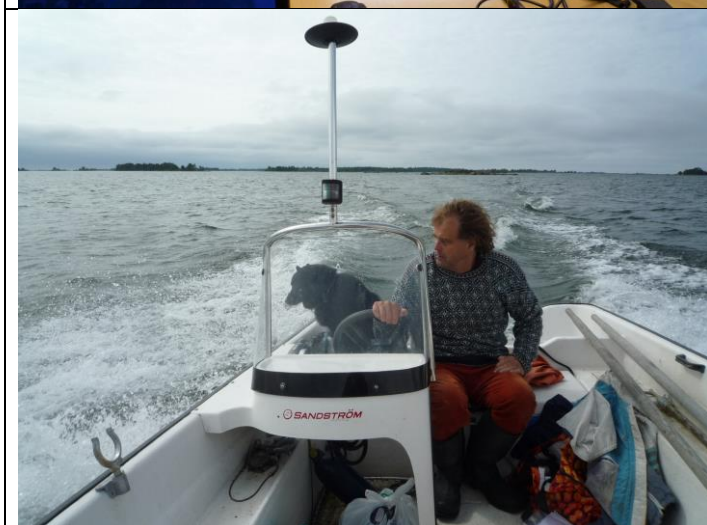
Kuva 2. Kaikki Merivaeltajan karttapaikat tarkastettiin maastossa talkoovoimin.