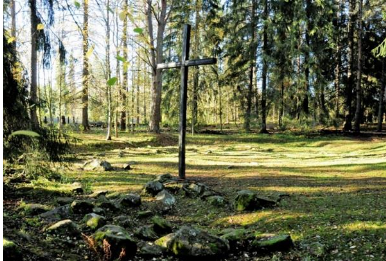
Kuva. Liikistön palaneen puukirkon paikalle on myöhemmin alettu rakentaa suorakulman muotoista kiviperustusta, joka on jätetty kesken. Puukirkon alttarin kohtaan on pystytetty kookas muistoristi.

Liikistö on keskiajan alkupuolella noin 1200–1340/1400 v jaa. meren rannalla, Kokemäenjoen suistossa sijainnut saari. Paikalla on ollut hautausmaa, todennäköisesti kirkko tai kappeli, mahdollisesti Pyhän Gertrudin kiltatalo ja myös asuinrakennuksia. Se on ollut keskiajalla merkittävä saksalaisten kauppiaiden kauppapaikka. Liikistö on muinaisjäännöksenä ainutlaatuinen.