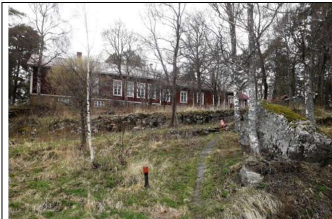
Kuva. Kellahten 140-vuotias entinen kansakoulu toimii nyt kyläyhdistyksen toimipaikkana.