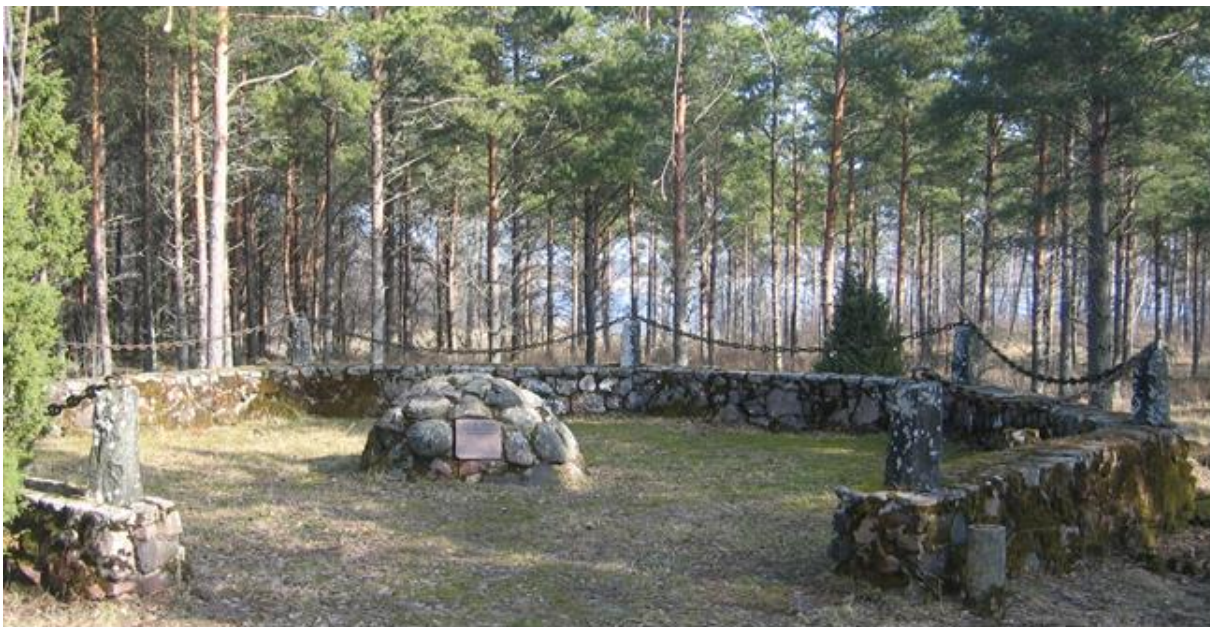
Kuva 1. Kappelin muistomerkki kivikehän sisällä.

Muistomerkin sijainti Porin suunnalta tullessa: 200 m Kappelinsillan jälkeen tie kääntyy jyrkästi oikealle. Rautatien jälkeen käännetään jälleen oikealle. Muistomerkki on vasemmalla pienen mäen päällä.