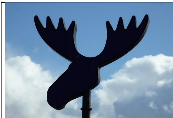
Kuva 6. Huittisten Toinen hirvi (Kimmo Ojaniemi 2000). Valokuva: Lasse Lovén.

Meijerin viereisellä pellolla seisoo Kimmo Ojaniemen vaikuttava valoteos ”Toinen Hirvi” (2000). Teos oli kolmannen vuosituhannen ensimmäinen julkinen taideteos Suomessa. Se paljastettiin juhlain menoin 1.1.2000 klo 00.00.