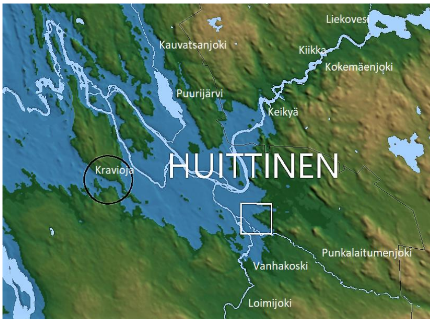
Kuva 1. Litorinameren (sininen) ranta oli kivikauden puolivälissä noin 6500 vuotta sitten Huittisten laajan muinaislahden perukoilla. Kartassa on merkitty valkoisella nykyiset jokiuomat ja järvet sekä joitain paikannimiä, jotka auttavat kartan havainnollistamisessa. Kartta: Satakunnan Museo - Muuritutkimus Oy.

Huittisten suurin joki on Kokemäenjoki, joka virtaa noin 43 m korkeustasolla läpi tulvistaan kuuluisan Vesiniityn peltolakeuden kohti Kokemäkeä ja merta. Kokemäen Kolsin voimalaitoksen pato vaikuttaa Huittisissäkin, jossa se hidastaa joen virtausta ja nostaa jonkin verran joen pintaa. Huittisten peltojen keskellä Kokemäenjokeen yhtyvät Loimijoki sekä pienemmät, Sammunjoki ja Ala-Kauvatsanjoki. Lähellä Loimijoen suuta sen virtausta vahvistaa Punkalaitumenjoki. Järviä ei Huittisten alueella enää ole, mutta sen sijaan luoteisosassa on laajoja soita. Puurijärven ja Isonsuon kansallispuiston eteläpää eli Isonsuon laaja kohosuo ja pääosa Ronkansuosta ulottuu Huittisten puolelle.