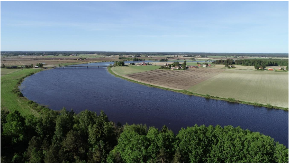
Kuva 2. Ripovuoren laelta on mahtava valtakunnan tasolla arvokas maisema Kokemäenjoen uoman ja peltotasangon suuntaan.

Karhiniemen kylää vastapäätä Kokemäenjoen toisella puolen sijaitsee Ripovuori . Sen laki nousee korkeuskäyrälle 78 m mpy. ja 36 metriä joen pinnan yläpuolelle. Lisää näkyvyyttä vuorelle jokilaakson maisemassa antaa 72,9 m korkea linkkimasto. Vuoren lähiympäristössä on ollut kivikautinen asuinpaikka. Ripovuori on ollut mainio tähystys- ja turvapaikka, josta on voinut valvoa Kokemäenjoen liikennettä. Joki on aikanaan ollut koko läntisen Suomen tärkein kulkureitti. Vuori nousi saarena näkyviin noin 8300 vuotta sitten muinaisen Ancyclusjärven kallioluotona. Ripovuoren nimi liittyy Kokemäenjoen yläjuoksun erämiesten käyttämään Ri-alkuiseen nimiperheeseen (esim. Sastamalan Ritajärvi ja Riippilä). Ripovuorelta näkyvä jokilaakson maisema on osa valtakunnallisesti arvokasta Kokemäenjoen kulttuurimaisemaa.