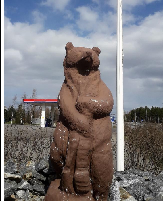
Kuvat 29 ja 30.

https://fi.wikipedia.org/wiki/Maatalouslakot_1917