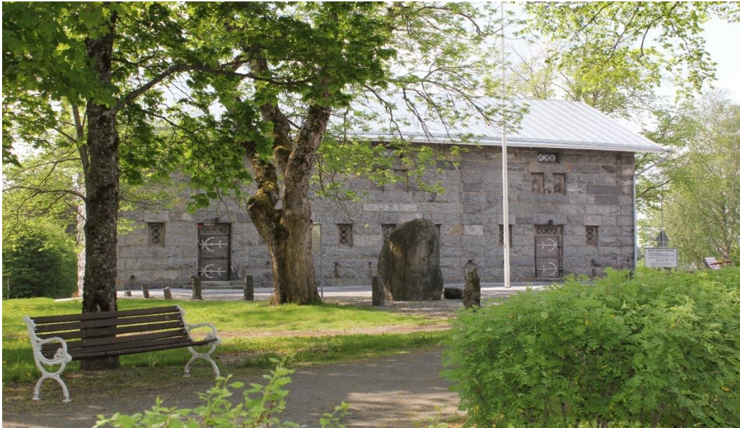
Kuva 10. Huittisten museo toimii kirkonseudun kulttuurimaisemaan sijoittuvassa harmaakivisessä pitäjänmakasiinissa vuodelta 1902. Vuodesta 1950 museo on ollut avoinna yleisölle.

Huittisten museossa on näyttelytilaa kolmessa kerroksessa. Museon sisääntuloaulassa on lyhyt esittely alueen esihistoriasta. Nähtävänä on mm. tarkka jäljennös kuuluisasta Huittisten Palojoelta löytyneestä Hirvenpää-veistoksesta. Alkuperäinen, lähes 8000 vuotta vanha veistos on nähtävänä Suomen Kansallismuseossa Helsingissä.