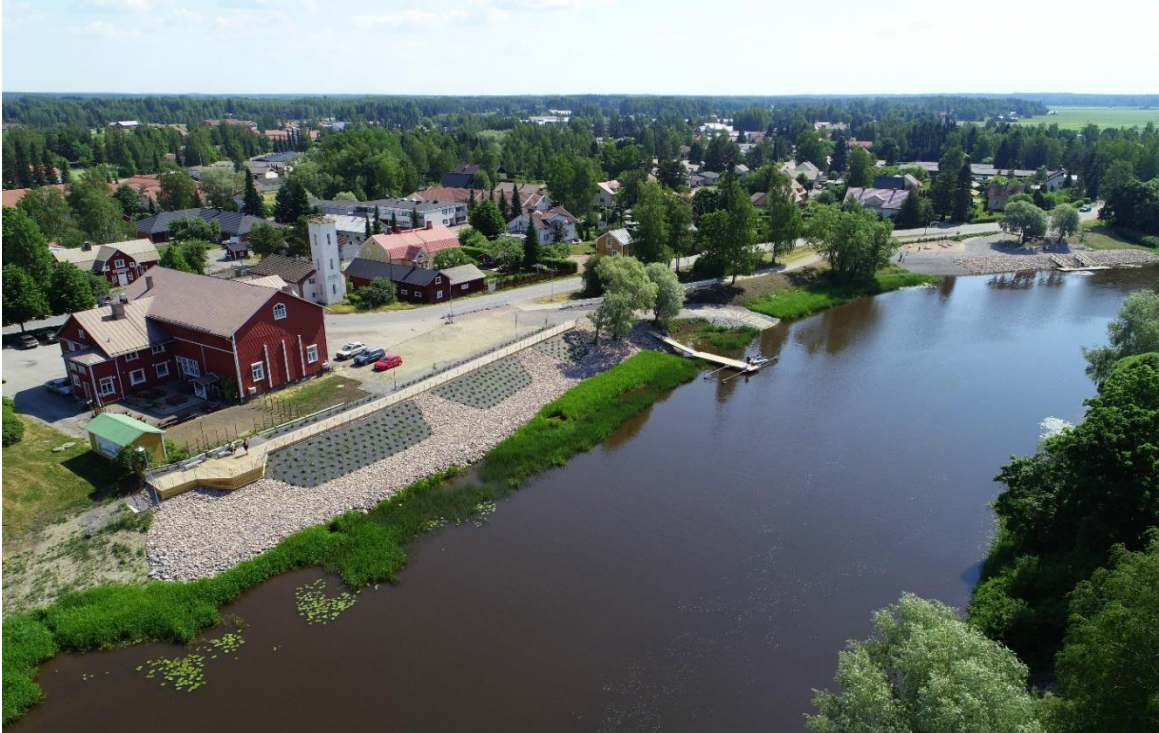
Kuva 17. Huittisten WPK:n talo on ollut todellinen monitoimitalo. Talon vieressä Loimijoen rannassa on pysäköintialue sekä kaupungin rakentama vuonna 2019 avattu uimaranta, rantapuisto ja veneiden laskuluiska.

Aikojen kuluessa WPK:n talossa on ollut monia vuokralaisia WPK-toiminnan ohessa. Varsin pian talon valmistumisen jälkeen WPK siirtyi sosiaalidemokraattien johtoon ja talosta tuli työväenjärjestöjen tukikohta. Pitkäaikaisin vuokralainen WPK:n talossa onkin ollut Huittisten Työväenyhdistys ry. Myös Huittisten Nuorisoseura ry viipyi talossa pitkään vuokralaisena. Lyhyempiäaikaisia vuokralaisia oli mm. kunnan kiertokoulu ja sekä punakaarti että suojeluskunta. WPK:n talo toimi ajoittain myös kunnantalon ja sotilasmajoitukseenkin taloa on käytetty.