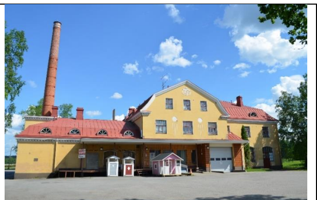
Kuva 7. Huittisten Meijeri

Huittisten meijeriin liittyy aikoinaan paljon puhuttu meijerikahakka kesällä 1917. Loppukevällä 1917 oli julistettu maa- ja meijerityöläisten lakkoja Länsi-Suomen vankimmilla maatalousalueilla. Niin oltiin tekemässä Huittisissakin. Maatyöläiset vaativat 8 tunnin työpäivää, jota isojen talojen isännät kiivaasti vastustivat. Eräät meijerin osakkaat halusivat jatkaa voim kirnuamista ja hankkivat kymmenkunta aseellista miestä turvaamaan meijerin toimintaa. Huittisten Meijerin edessä käytiin 13.7.1917 ensimmäinen aseellinen yhteenotto, jossa haavoittui seitsemän miestä.