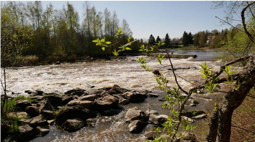
Kuva 18. Vanhankosken lehdon rantamia Huittisissa Loimijoen varrella.

Vanhankosken lehtoalue sisältää niittyjä, kuusikoita ja leppä- ja pihlajaviidakoita, lammaslaitumia, koskien kohinaa ja jyrkkien rinteiden reunustamia vähäisiä lampia. Vanhankosken lehto on valtion, Huittisten kaupungin, vesialueen osakaskunnan ja useiden yksityisten omistama arvokas Natura-ohjelman luontoalue. Alueen kasvillisuus ja linnusto ovat lehtoalueen erityisen suojelun perusteena. Melkoinen osa alueesta on rauhoitettu luonnonsuojelulain nojalla. Lehdon reunalla on pysäköintialue ja siitä alkaa mielenkiintoinen luontopolku, jonka varrella on lammassaitauksia, nuotiopaikka ja pitkospuita. Kaupungin omistaman Saaren tilan perinnemaisema omenapuineen, kukkaniittyineen ja rantasaunoineen on idyllinen osa alueen luontoa.