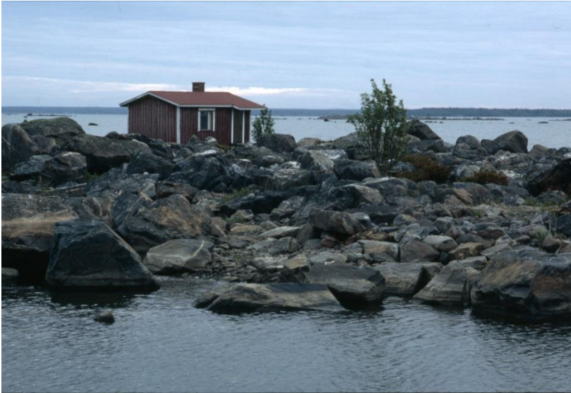
Pikku Skaddin luodolla on Sainen Joukon kalakämppä.