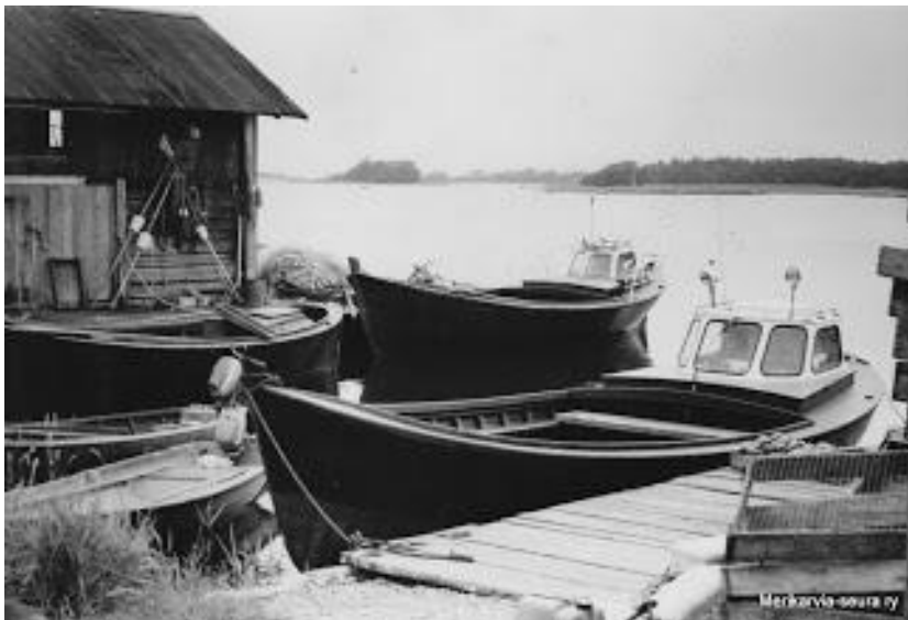
Venerantojen silakkapaatteja 1980-luvun alussa.

Silakkaverkoilla me käyti pohjoses aina Sillan matalas saakka. Eteläs me käytiin Sumpparissa ja Harjulla , ja Kaijan takana ( Porin edustalla). Mutta harvoin. Se oli kolmen tunnin ajomatka, ko kuudelta aamulla olis tarvinnu olla silakat pois verkoista. Ainoastaan syksyllä käytiin näin pitkällä. Viimeks käytiin silakkarääkis keväsin, oliko se keväällä 1990 tai 1991 viiminen kerta.