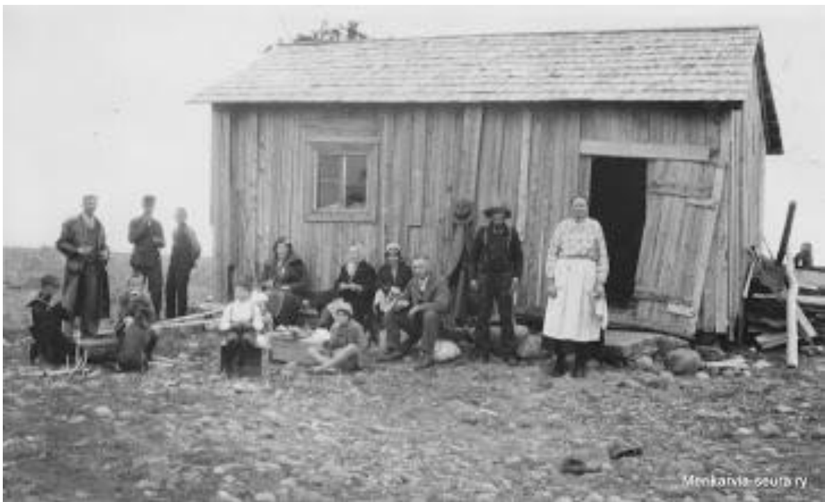
Rävelin kalastuskämppä.

Sitte siellä (Revelin kämpässä) kävi semmone ko x (ei-ammattikalastaja). Se meni taas sinne, en tie millä se oli hakattu, lukkoo ei saa auki. Hän hakkas sen lukon. X oli ollu vihanen, että kämpän ovi oli pantu lukkoon. Mä toimin vaa niinko miehet käskee. Ei siellä ol kukaa käyny siinä kämpäs. Siittä on niin paljo aikaa. Lasse eli silloin vielä. Siittä tulee 18 vuotta, ko Lasse on hukkunu.