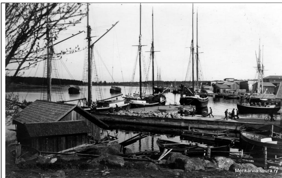
Merikarvian satama 1900-luvun alussa.