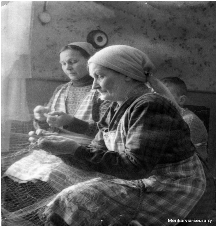
Naisväen kontolla oli yleensä verkkojen parantaminen.

Monen kalastajan kotona emäntä ei parantanu , taikka sitte ei ollu emäntää. Ni sitte verkot vietii muualle. Niitä oli paljo, jotka paransi. Saliinilla ja joka puolella sillai oli näitä vanhoja kalastajien vaimoja, jotka teki niitä. Ensimmäinen kysymys oli ko verkko tuotii ja vietii parantajille , että pistetääkö silimipavot ja? Yleensä ei laitettu silimipakoo, ko tuli kauheesti solomuja. Ni ei se kalasta ko tulee solomunpäitä. Ja ko sä teet sen hyden tankon , laitat siihen. Ni ei sillä mitään hyötty tavallaan ol. Mutta kakstapposet vasta, ni sillä voi lähtee. Siihen tulee vaa kauheet solomut ko tuli siihen eheeseeki solomu . Tietysti se oli kumminki helepompi pumpulis , ni siihen ei tarvinnu tehedä solomuja niin paljo ko nailonii . Siinä se pysy, ko tervataa. Ni se meni kerralla vaa heittolenkillä. Aksu ei saanu (antanu) juoksuttaa koskaa. Se tarkoittaa sitä, että ko on kaks reikää, jos on kakstapposia , sillai että on silimä välis, ni ei saanu juoksuttaa eli siis mennä yli sillä eheellä. Kato ko lanka kulu ko oli yks silmäväli. Mutta isä oli aina, että siihen, että jos sä jodut lähtee uudestaan sitä aina juoksutettii aina ylitte. Tottakai, jos oli iso reikä ni tehdää paikko tai paikka.