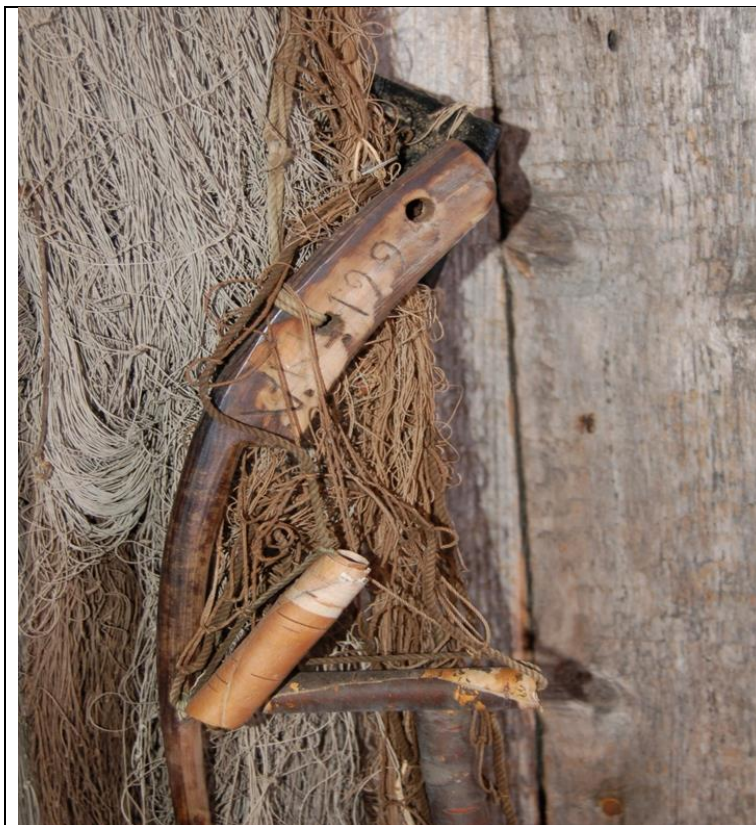
Verkon puupuikkari ja tuiju eli tuohikoho.