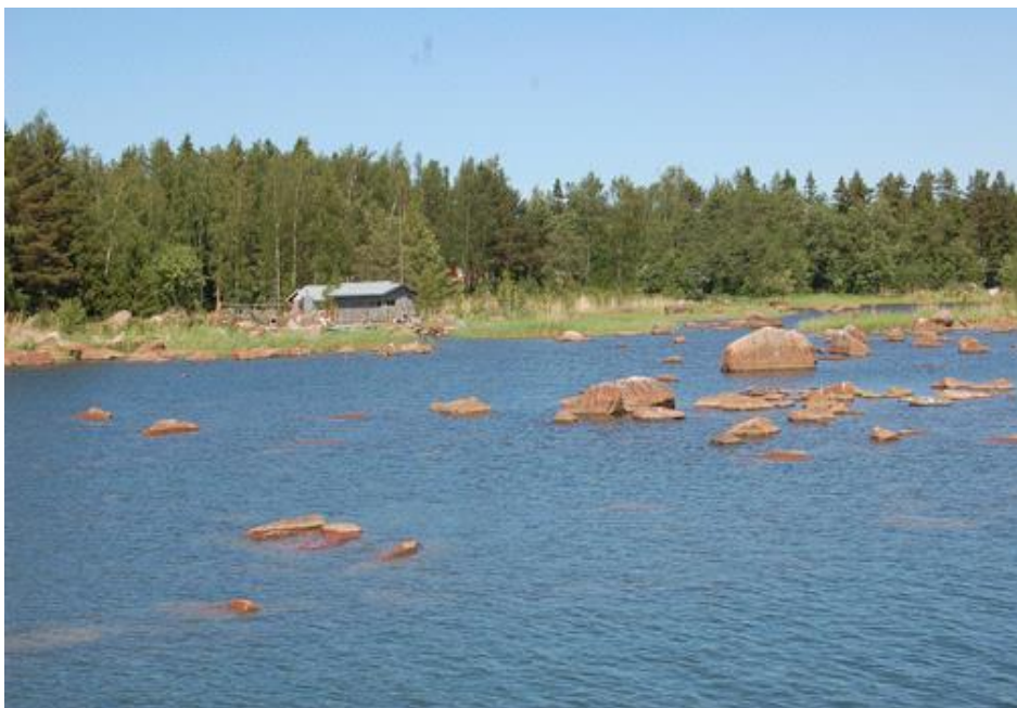
Uusi-Rantasen rantahuone Kasalan kalasatamasta nähtynä.

Aarre: Sitte on Winterin laaka , se on yksittäinen kivi, punagraniittinen kivi. Aikoinaan Tuomisen Kalle kävi Kummelgrunnista Winterin laakalla uimassa ja takasin.