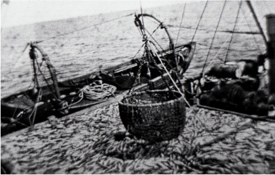
Sillilaiva PETSAMOn vinssihaavi nostaa saalista laivan ruumaan.

vinssihaavilla isoon ruumaan. Vinssi nosti haavin. Se nousi ylös kuule. Siin pohjas oli semmone systeemi et ko mies veti narust ensimmäisen kerran ni lukko aukes ko veti toisen kerran ni lukko meni kii.